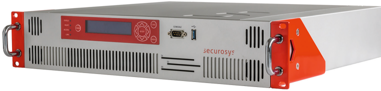
Primus Hardware Security-Modul der X-Series.